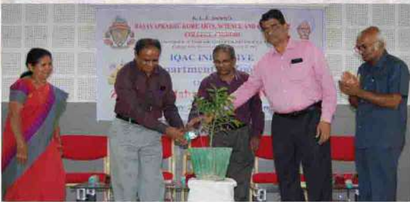
ಕಾರ್ಯಾಗಾರವನ್ನು ಪ್ರಾಧ್ಯಾಪಕ ಡಾ.ಗಿರೀಶ ಕಾಡದೇವರು ಉದ್ಘಾಟಿಸಿದರು